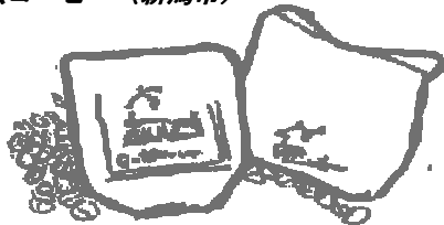
自家焙煎コーヒー (新潟市)