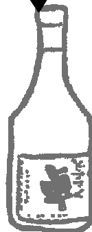
どぶろく「卓」(上越市)