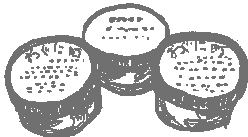
ぎんなんアイスクリーム (小国町)