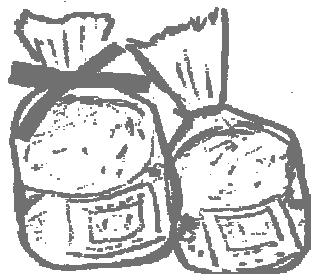
手作りスコーン (新潟市)