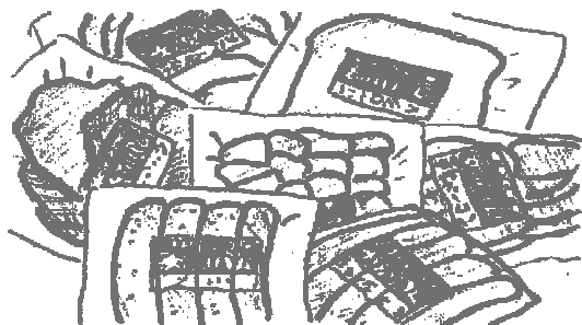
女川手作りハム・ソーセージ (関川村)